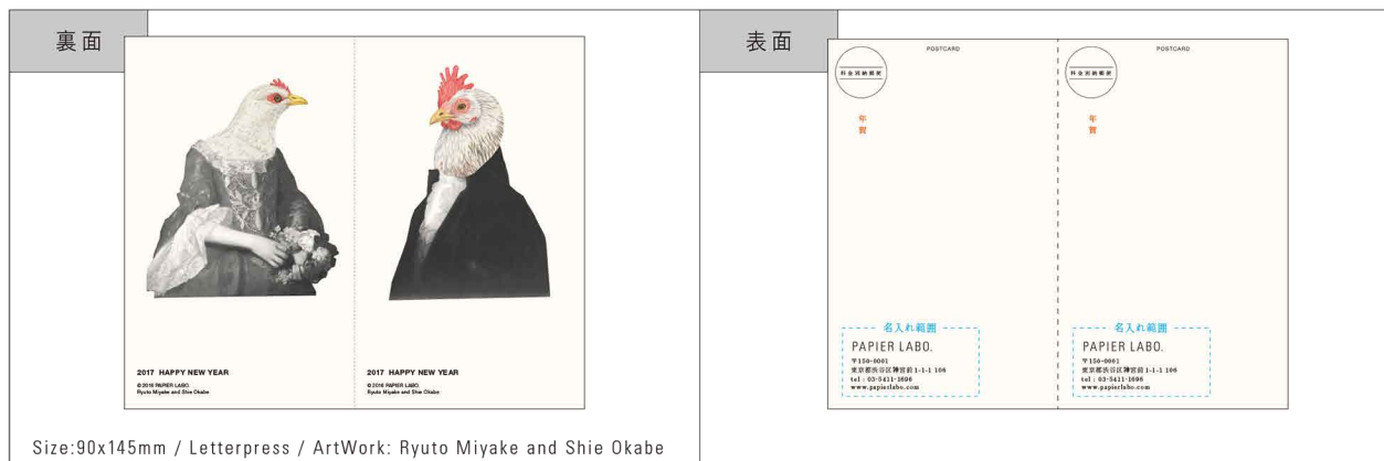
Size:90x145mm / Letterpress / ArtWork: Ryuto Miyake and Shie Okabe